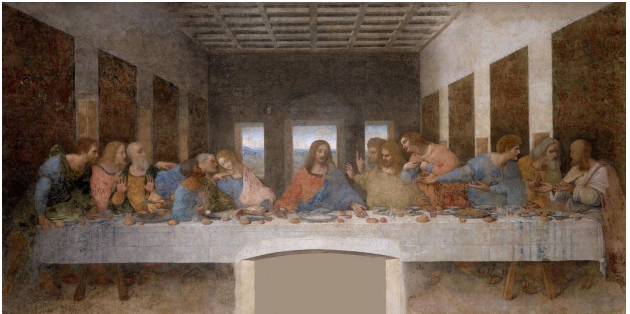
Леонардо да Винчи «Тайная вечеря». 1495-1498. Монументальная роспись. 460 × 880 см. Церковь Санта-Мария-делле-Грацие, Милан.